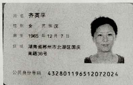
委托授权人身份证